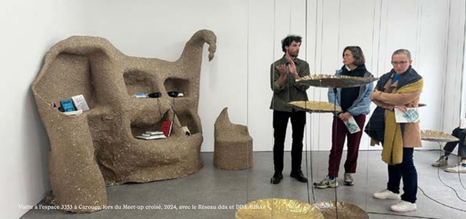
Visite à l'espace 3353 à Carouge, lors du Meet-up croisé, 2024, avec le Réseau dda et DDA AuRA